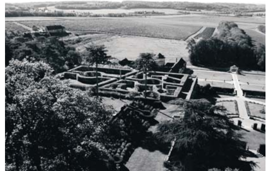
Le jardin vu du ciel