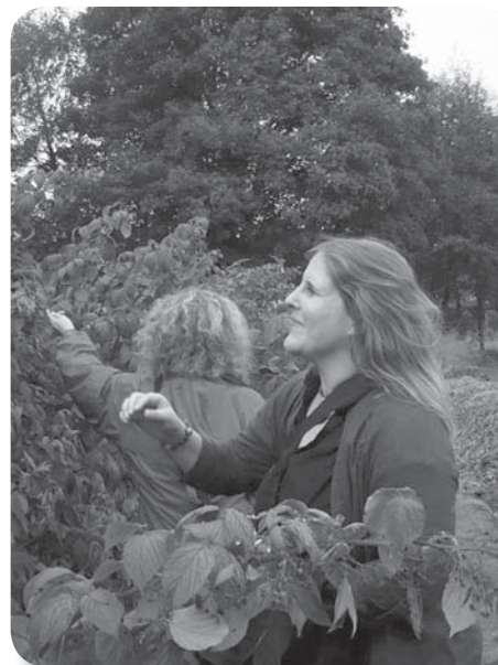
À la découverte des Parcs et Jardins en région Centre