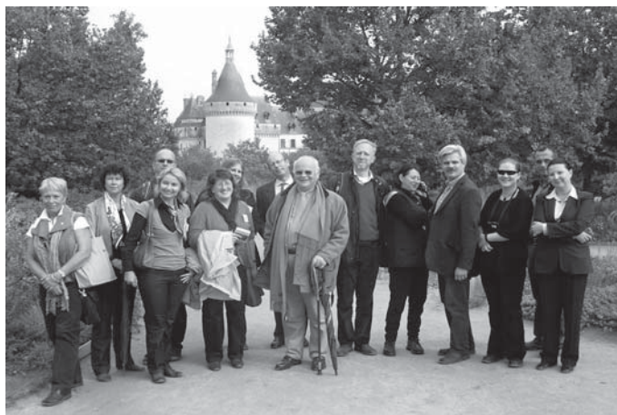
La délégation lors de la journée à Chaumont-sur-Loire

Parcs et Jardins de la Région Centre » : le Conseil régional du Centre s'est dotée d'une Stratégie Régionale de Développement Touristique pour la période 2006-2010. La filière « Parcs et Jardins » est considérée par le Conseil régional comme une filière prioritaire, notamment :