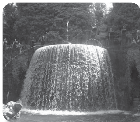
Italie - Allemagne A la découverte de sites fabuleux !