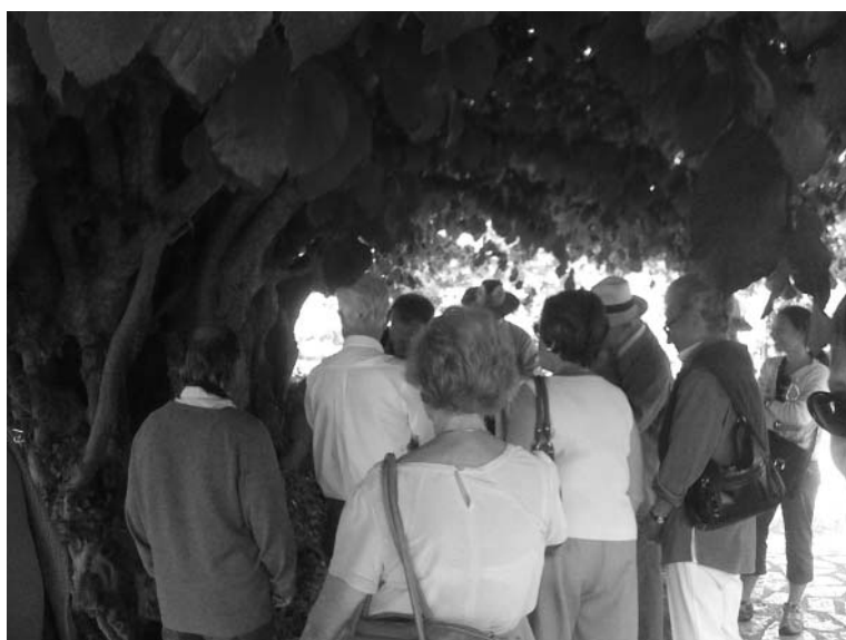
Le Jardin des Plantes possède une collection d'arbres remarquables.

La visite de la nouvelle extension et de l'arboretum nous réserve de nombreuses surprises, tant par la rareté des sujets plantés que par leur taille imposante.