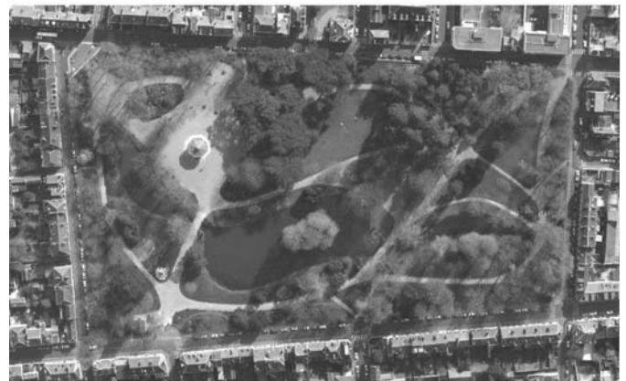
Plan du jardin des Prébendes d'Oë par Eugène Bühler et vue aérienne actuelle à l'échelle.