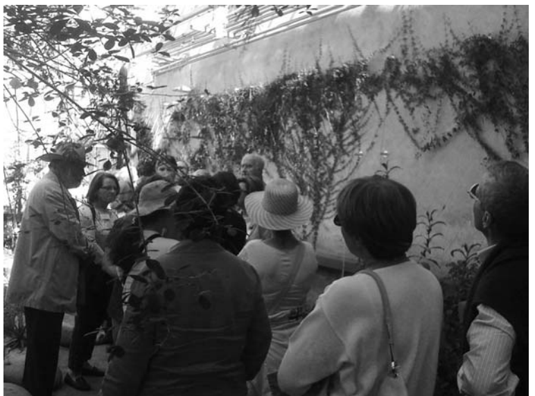
Les serres de l'Orangerie ont été récemment restaurées et présentent un intérêt pédagogique

Les serres de l'Orangerie, récemment restaurées, présentent des plantes d'autres continents, avec une thématique sur l'Afrique du Sud dans la première et une exposition de plantes utiles à l'homme dans la serre tropicale. Un peu partout, des sachets blancs mis en place constituent des moyens de lutte biologique. Il s'agit d'acariens prédateurs appelés des phytoséiides. Les acariens, introduits dans la serre, sont des Amblyseius swirskii . Ces prédateurs sont utilisés pour lutter contre les aleurodes (mouches blanches) mais aussi les thrips. Ces 2 insectes sont très souvent rencontrés dans les serres et causent des dégâts importants sur les végétaux: leurs piqûres répétées affaiblissent les plantes. Un traitement efficace à en juger la bonne santé des végétaux dont l'irrésistible Begonia fuchsioides .