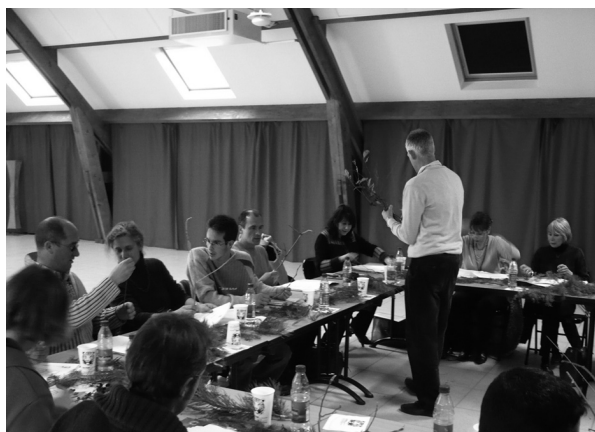
Ambiance studieuse pour la journée-formation botanique du 16 novembre 2007