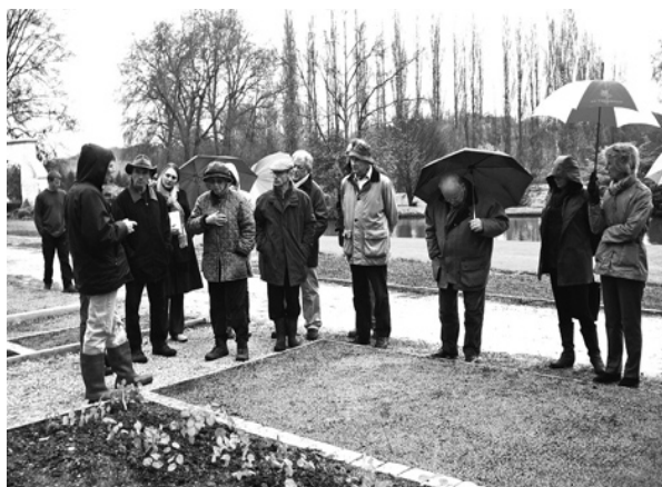
La journée-formation du avril 2008 sur les plantes couvre-sol a connu un tel succès que nous avons dû programmer à nouveau une session quinze jours plus tard